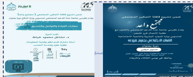
دورة لمنسوبي ضمان الاجتماعي ودورة قدمت لأسر الشهداء