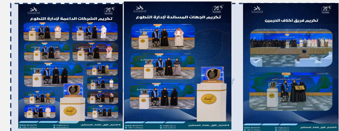
التكريم للشركاء والجهات الخارجية في ملتقى مبادرون3