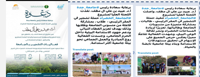
فعالية التشجير بجامعة جدة