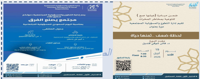
مبادرة عيشها صح للتوعية بمخاطر المخدرات ولقاء مجتمع يصنع الفرق بمناسبة اليوم السعودي للمسؤولية المجتمعية

يرجى استبدال كل إطار بصورة فعلية من الفعالية مع كتابة وصف مختصر أسفلها